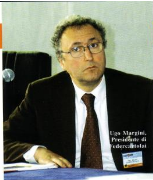
Ugo Margini, Presidente di Federcartolai

distribuzione. E che sarà sostenuta anche da una capillare campagna di comunicazione a livello nazionale e locale. Rientra infatti in una operazione denominata “La convenienza in cartoleria” , che verrà pubblicizzata attraverso i media, attraverso il materiale sul punto vendita (locandine, vetrofanie, volantini) e le attività di web marketing effettuate su portali tematici. I rivenditori partecipanti saranno infatti inseriti gratuitamente nei portali www.prodottiscuola.it e www.cartoleriainitalia.it e potranno, per esempio, stampare dal proprio computer il materiale pubblicitario, essere informati sui fornitori da cui acquistare i prodotti per confezionare il proprio Scuola Kit o segnalare il proprio punto vendita come aderente all'iniziativa. L'intento finale, in ogni caso, è quello di fide-